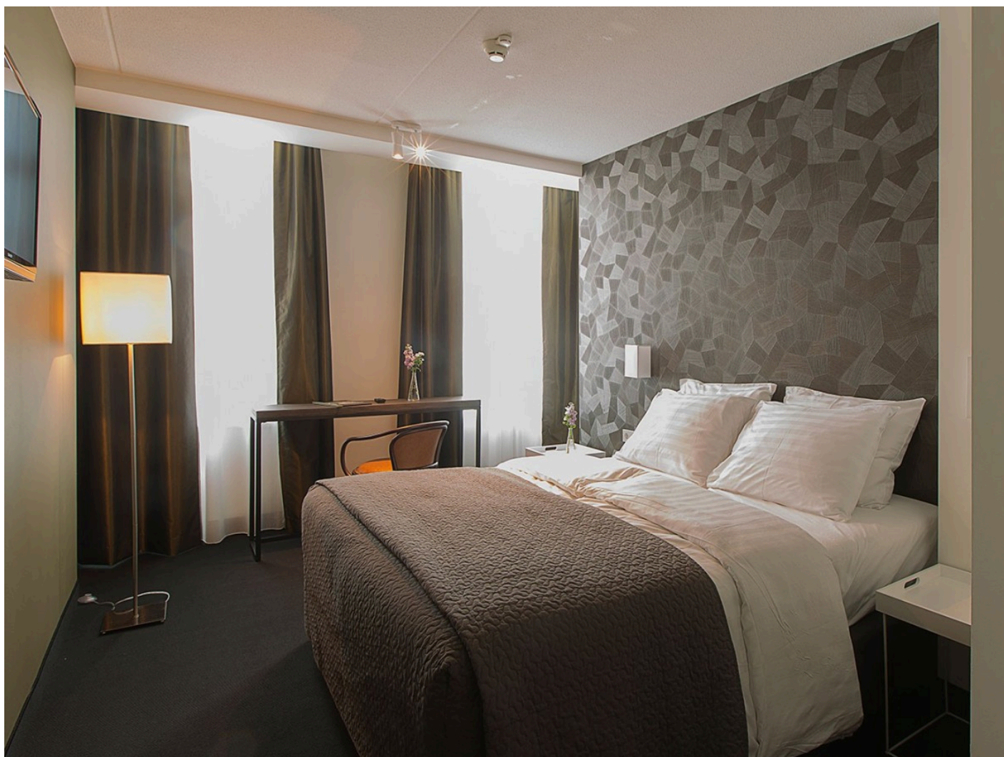
Hotel Mauritz *** (Willemstad)