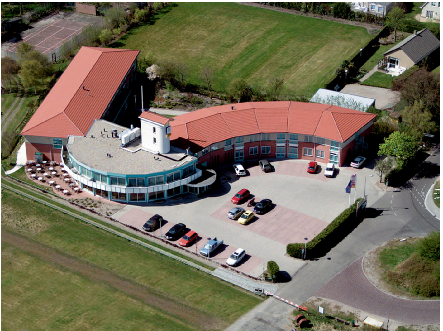
Fletcher Duinhotel Burgh Haamstede **** (Burgh Haamstede)