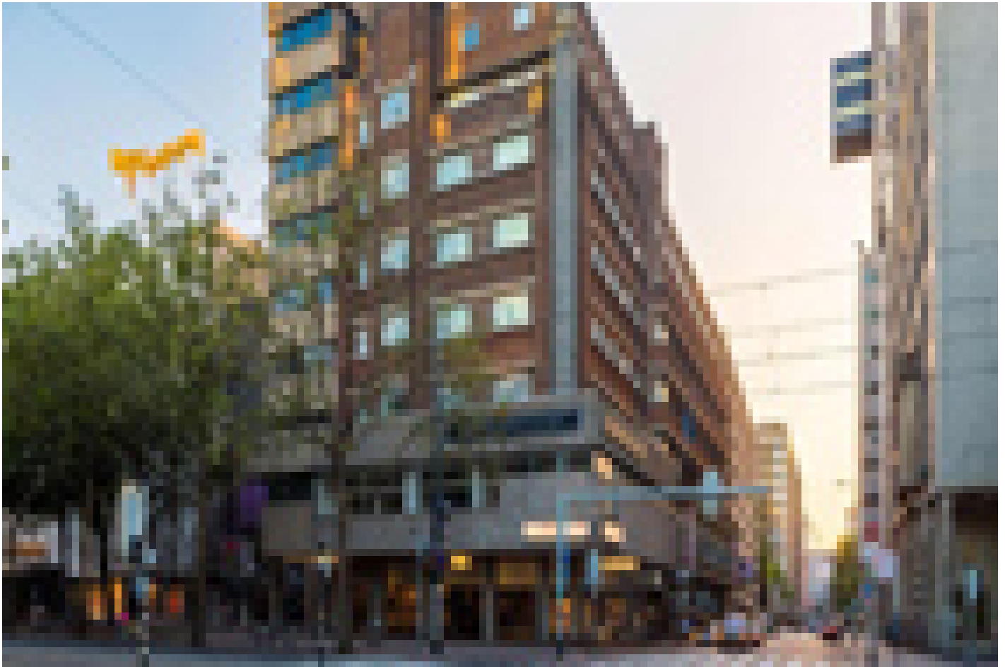
NH Hotel Atlanta Rotterdam **** (Rotterdam)

A la hora de seleccionar los hoteles, intentamos tener en cuenta en la medida de lo posible un cobertizo para bicicletas seguro y cerrado. Sin embargo, no podemos garantizar esto en todos los hoteles y esto depende en parte del número de bicicletas de otros huéspedes del hotel.